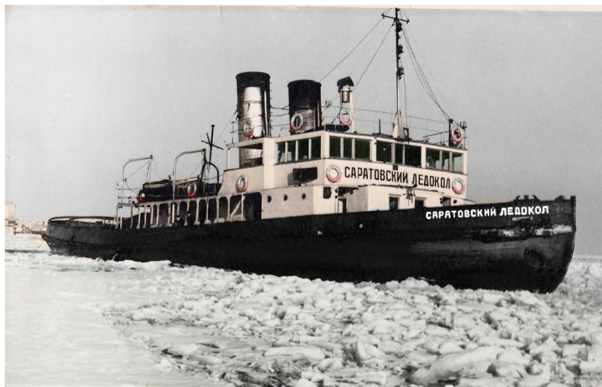
Рис. 1 – Саратовский ледокол производства компании Sir W.G. Armstrong Mitchell & Co (Великобритания, Ньюкасл) (адапт. из [3])

В конце XIX века (а точнее, в 1895 году) английской компанией Sir W.G. Armstrong Mitchell & Co по заказу русского Общества Рязанско-Уральской железной дороги был построен Саратовский ледокол – он изображен перед вами на рисунке (рис. 1).